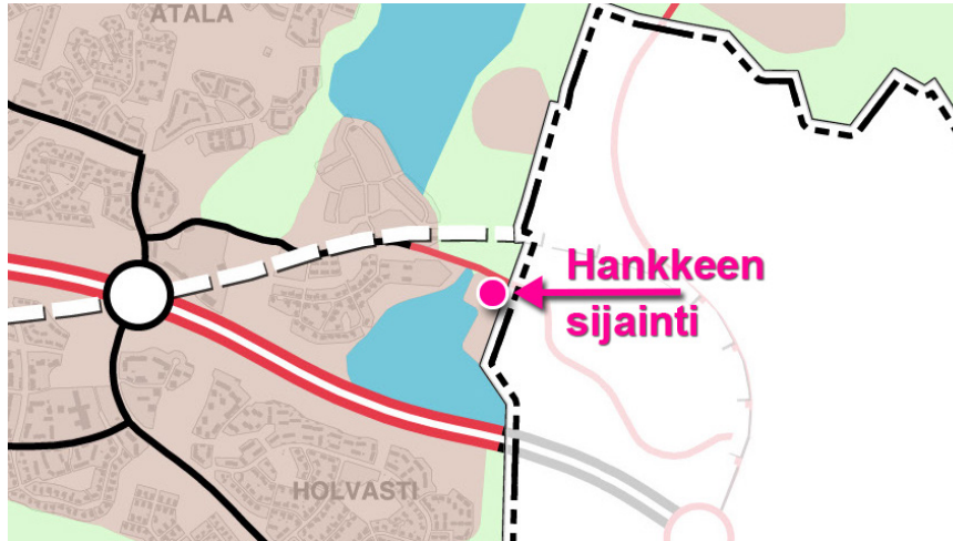
Kartta 1 Yhdyskuntarakenne